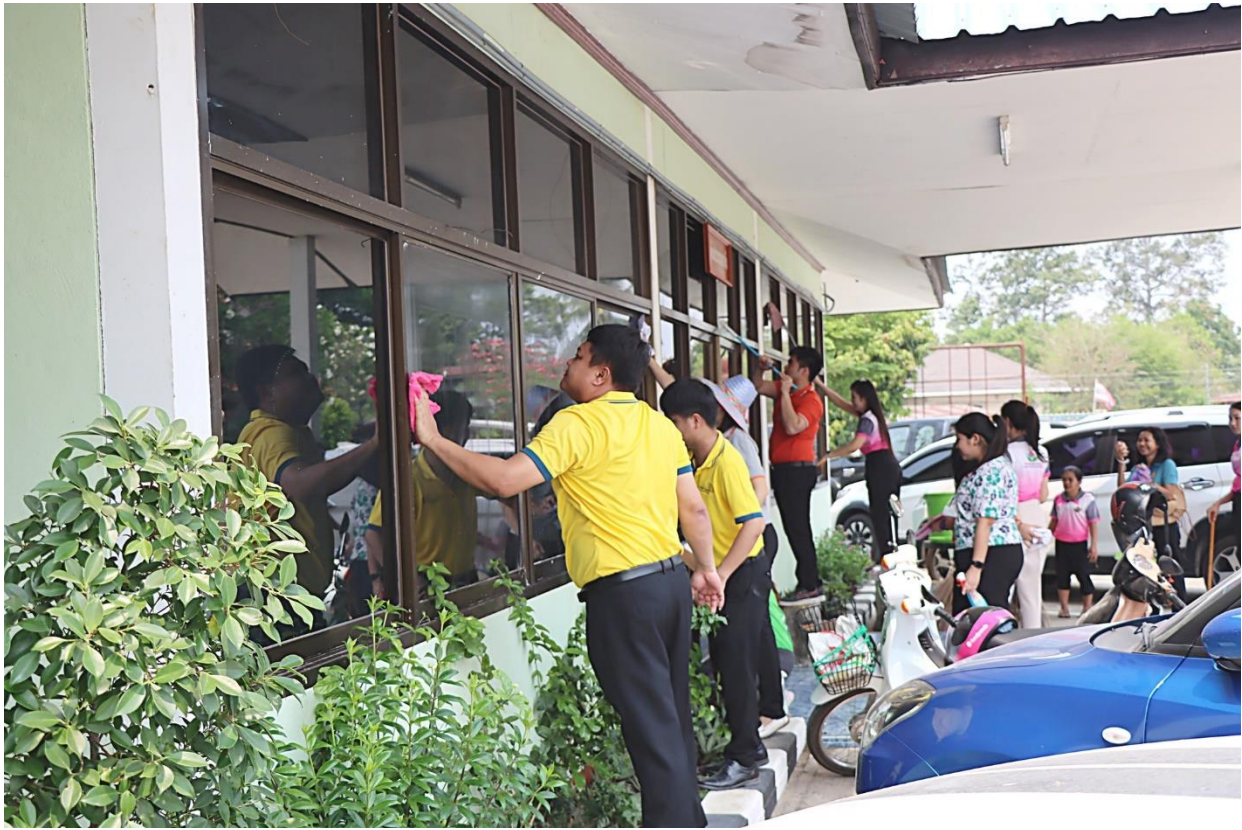
ภาพกิจกรรม โครงการประชุมเชิงปฏิบัติการสร้างจิตสำนึก สร้างสุขในองค์กร “Big Cleaning Day” สพ.ยโสธร เขต ๒ สำนักงานสะอาด ปลอดภัย เป็นมิตรกับสิ่งแวดล้อม