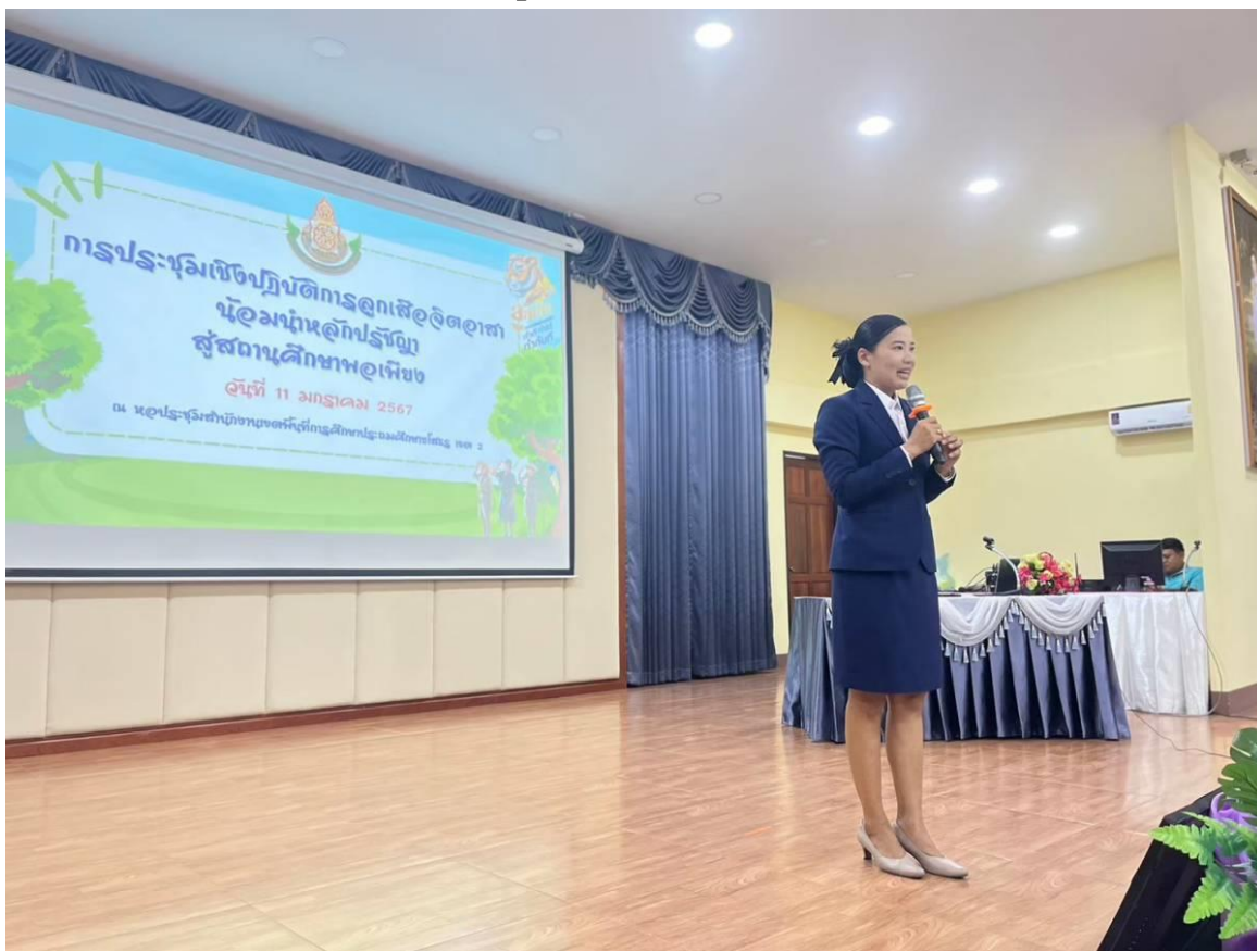
ประชุมเชิงปฏิบัติการให้กับสถานศึกษาที่ยังไม่ได้รับการประเมิน