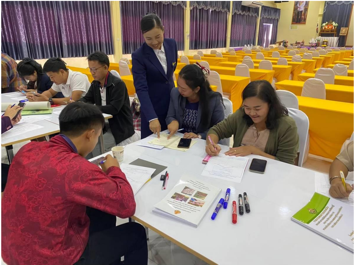
ระดมความคิดและนำเสนอ