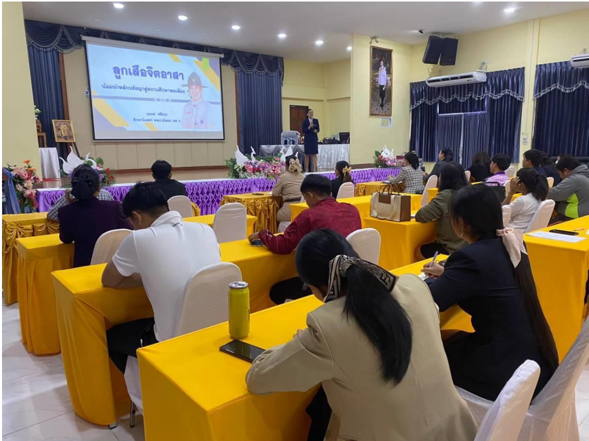
ผู้เข้ารับการอบรมให้ความสนใจเป็นอย่างดี