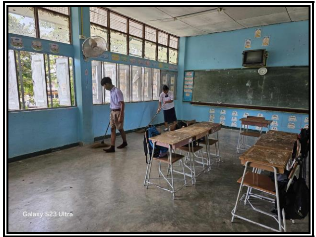
คณะครู บุคลากรทางการศึกษา นักเรียน ทำความสะอาดบริเวณภายในและภายนอกอาคารโรงเรียน